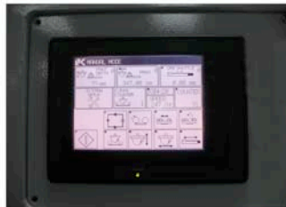
SPS-Steuerung mit Touch Screen Bedienfeld