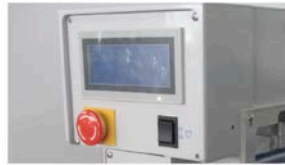
SPS-Steuerung mit Touch Screen Bedienfeld