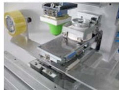
Klischeebeweger (Tamponreinigung darunter)