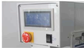
SPS-Steuerung mit Touch Screen Bedienfeld